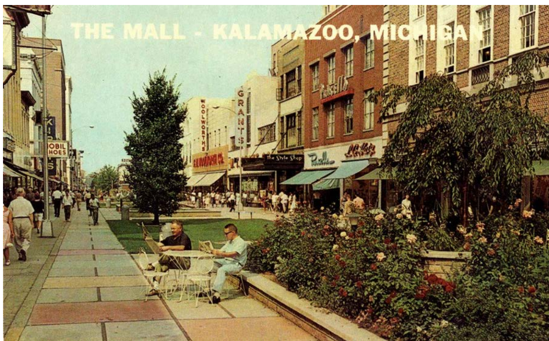
Рис. 4. Каламазу-молл, г. Каламазу 1959 год

создании пешеходных зон в центре города, и проект Груэна служит одним из ориентиров для подобных проектов 5 .