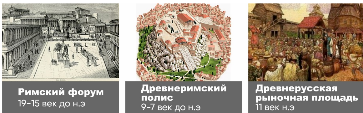
Рис. 1. Прототипы общественных пространств

В городах Древней Руси существовали торговые рыночные площади (рис. 1), где продавали свои товары как сами горожане, так и приезжающие в город жители сел и деревень, ездившие по разным землям торговцы, в том числе иноземцы.