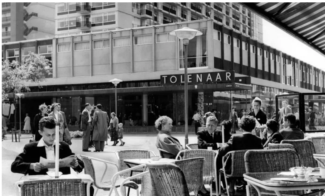
Рис. 3. Улица Лайнбаан, г. Роттердам 1953 год

После Второй мировой войны Американские города были застроены гигантскими торговыми центрами, которые стали вытеснять небольшие магазины из торговых кварталов. Виктор Груэн, один из архитекторов торговых центров, предложил свое видение такого комплекса: полностью пешеходный торговый молл под открытым небом 4 . По идее создателей, он должен был освободить посетителей от «тирании автомобиля», при этом сохраняя открытое уличное общественное пространство с магазинчиками и пешеходами, аналогично пешеходным улицам в Европе. Смелая попытка избавить центр города от уличного движения в качестве стимула к жизнеспособности городов и защиты от пригородов привлекла внимание всей страны к Каламазу, торговый центр в котором получил название «Каламазу-молл» (рис. 4). Концепция схожая с рыночными площадями увидела свет в 1959 году. В настоящее время все больше урбанистов задумываются о